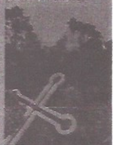
A Santa Cruz localizada no local mais elevado da Região Bragantina, o Pico do Lopo, graças são alcançadas nesta data.

Interessante observar que a comemoração da Santa Cruz precede o início do inverno e das colheitas e, com certeza, em algumas localidades tradicionais da Região Bragantina, esta data será venerada e louvada. Neste contexto podemos achar muitos motivos em admirar a fé e a sabedoria do homem do campo, que na sua pureza, pratica o Catolicismo no seu modo mais a Santa Cruz.