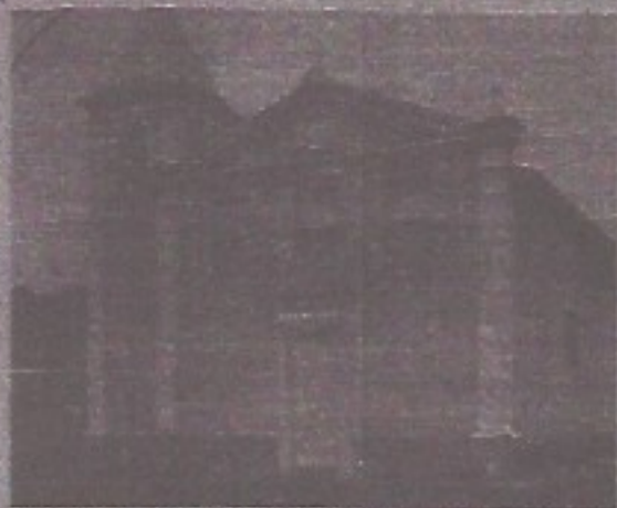
Igreja N. Sra. Aparecida do Lopo, edificada no local de Paragens dos Bandeirantes sinaliza a implantação da Santa Cruz na Região Bragantina.

Prova disso é que se visitarmos o sopé da Montanha do Lopo, onde está localizada a Igreja N.